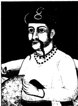
नवाब वज़ीर शुजाउद्दौला